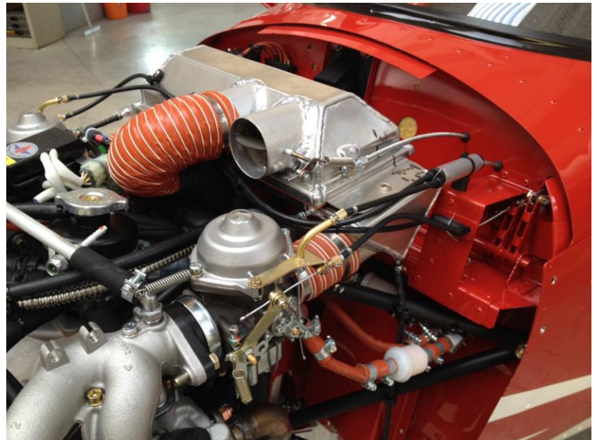
Il motore del Savannah S. Con l'aiuto dei meccanici specializzati si installa sulla struttura di supporto