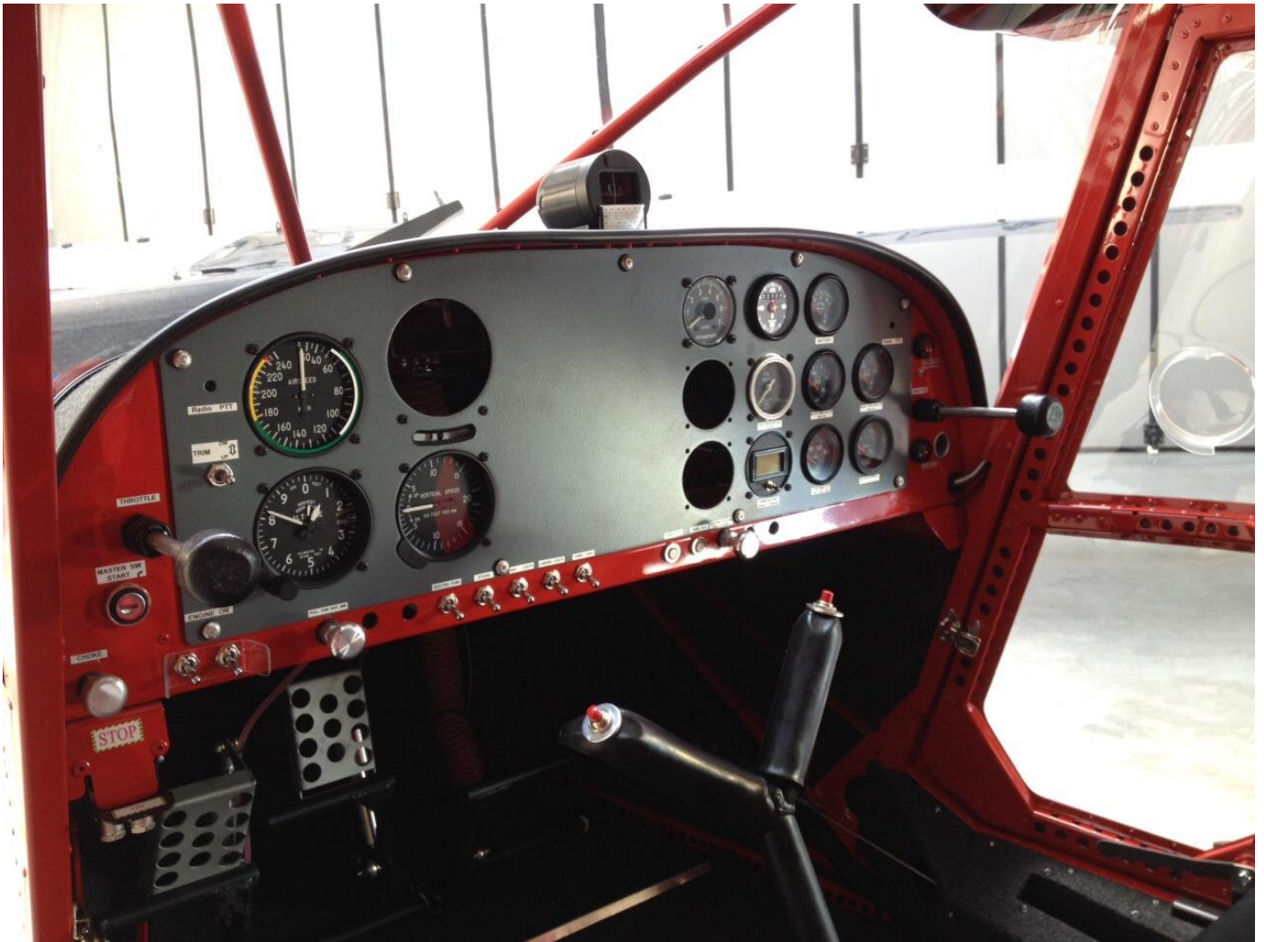
L'assemblaggio e l'installazione del pannello strumenti.