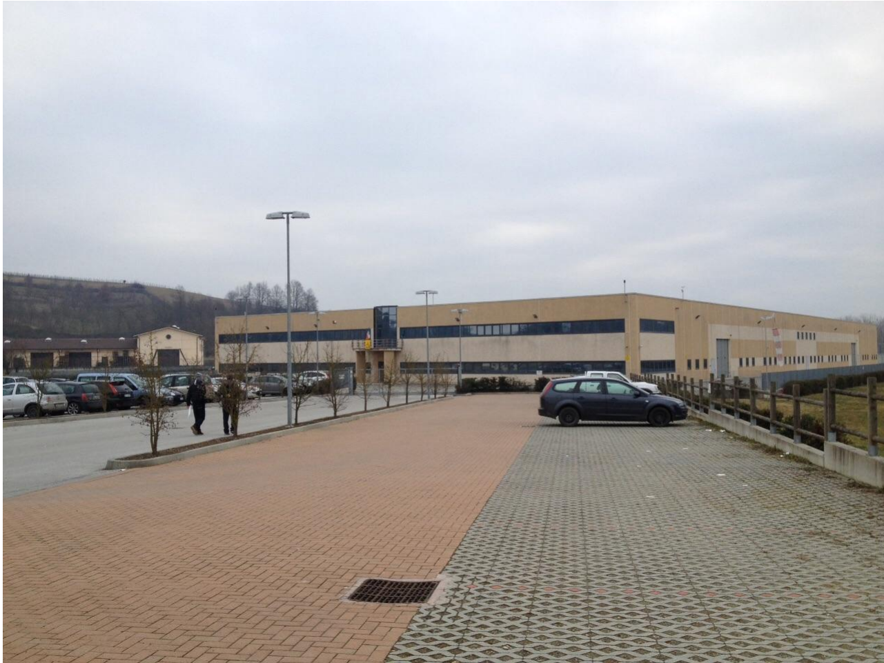
Lo stabilimento, suddiviso in tre diversi reparti. Sulla destra si trova il campo di volo.