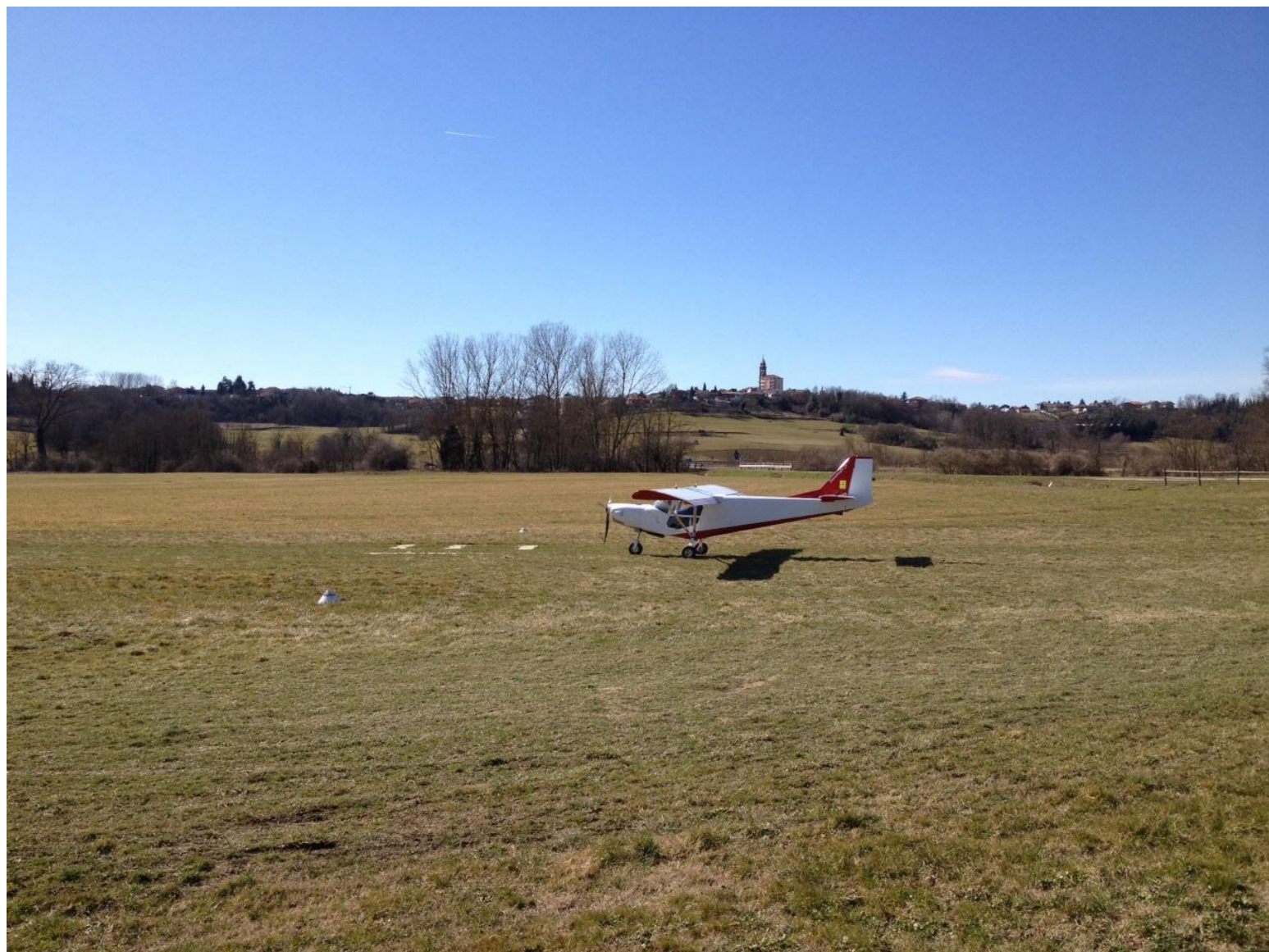
Un Savannah S in corsa di decollo. Sullo sfondo, in cima alla collina, il campanile di Buttigliera d'Asti.